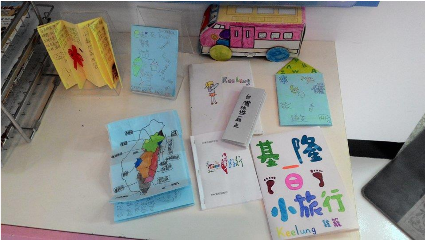
圖 3 愛台灣大連線學生創作小書作品