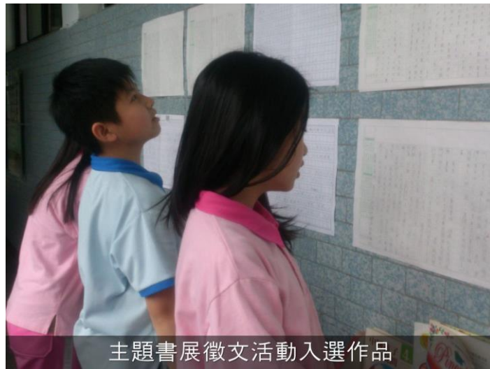
主題書展徵文活動入選作品