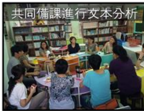
圖 1 教師共同備課情形