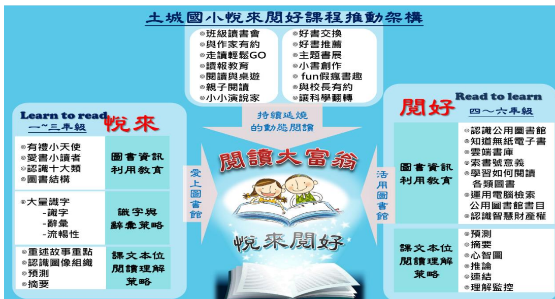
圖 2 土城國小悅來閱好課程推動架構